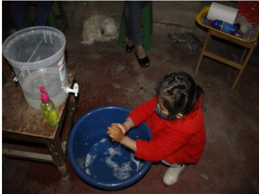
Een meisje uit een achterstandswijk wast haar handen met de sanitaire hulpmiddelen van Los Cachorros.

Los Cachorros tekende verschillende overeenkomsten met andere instellingen. Zo ook met UDAVIT, een programma van het Openbaar Ministerie. UDAVIT heeft de mogelijkheid om kinderen bij ons te plaatsen die onderdak nodig hebben voor de duur van een onderzoek. De overeenkomst is voor twee jaar. Ook o.a. met de school Señor de los Milagros een overeenkomst getekend. Los Cachorros krijgt hierdoor een basisschoolleraar aangewezen betaald door de staat.