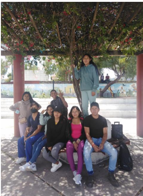
De kinderen op uitstapje naar het Acuchimay uitzichtpunt.